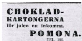
Annons från 1931