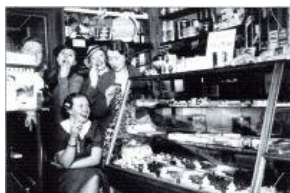
Glatt gäng i Pomonabutiken

Pomona låg på Kungsvägen 3, från 1931-1960-talets slut och var känd för att alltid ha fin kvalitet på sina produkter av frukt, konfektyr och av läskedrycker. De brukade också och göra tjugiga utställningar till jul. Känner du igen denna dörr? Kontakta museets personal så att vi kan säkerställa uppgiften och uppdatera informationen i vår samling.